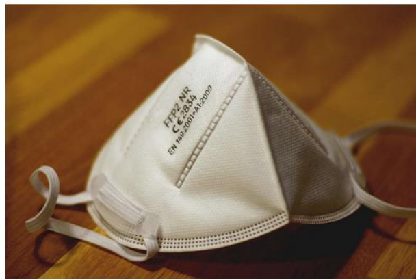
Beispiel für eine FFP2-Maske